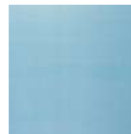
PROFILON® ALARM A1 white-matt with combined privacy protection.

The information contained in this data sheet is based on many years of practical experience and reflects our current status of knowledge and the current state of the technical art. This does not release the user/buyer from the duty to test the suitability of our products for the intended use on their own responsibility. Our General Terms and Conditions of Business also apply.