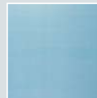
PROFILON® ALARM A1 weiß-matt mit kombiniertem Sichtschutz.