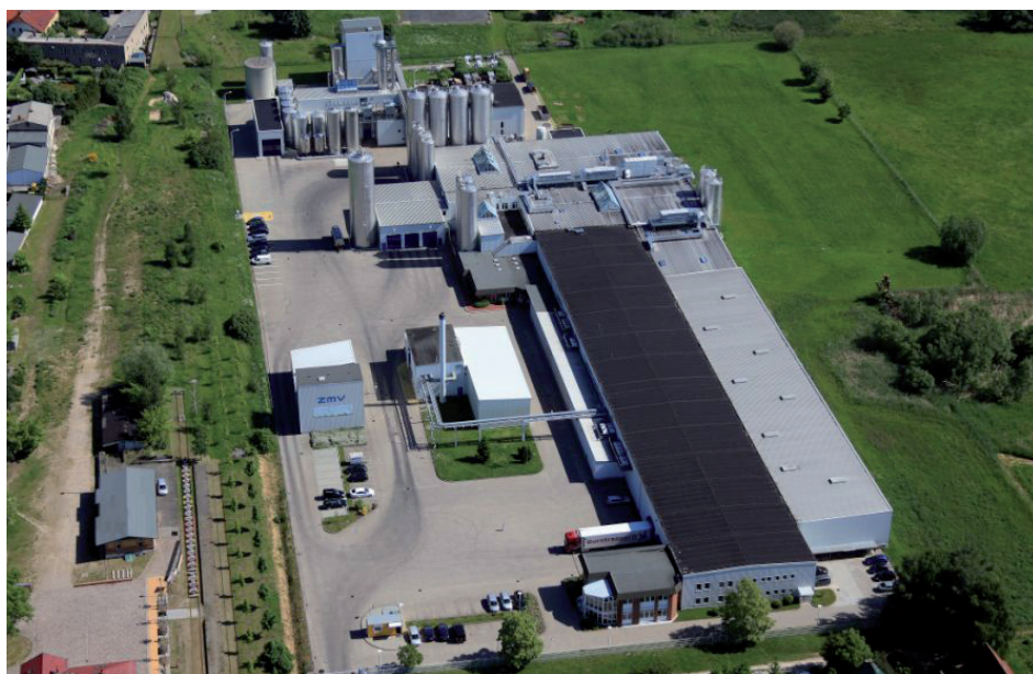
Standort Dargun der Zentralkäserei Mecklenburg-Vorpommern GmbH