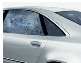
Secure Bond Serie