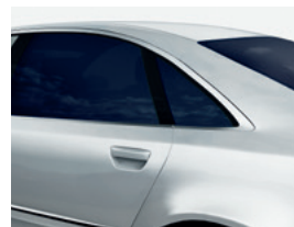
Best Bond Serie