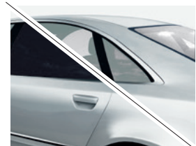
Special Bond Serie