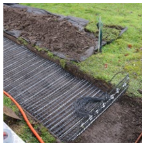
3. Zuschnitt verlegen