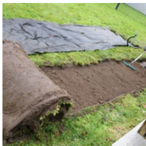
2. Boden aufnehmen