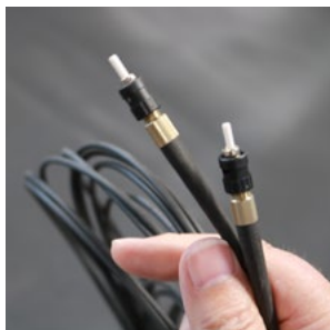
5. Verkabelung verlegen