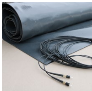
1. StepGARD® (konfektioniert) bestellen

Sie senden uns eine Skizze mit den benötigten Abmessungen. HAVERKAMP fertigt Ihnen die passenden Module anschlussfertig vor. Selbstverständlich erhalten Sie bei Bedarf eine ausführliche technische Beratung von unseren HAVERKAMP Sicherheitsspezialisten.