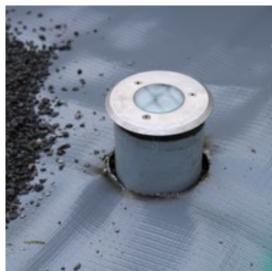
4. Aussparungen platzieren