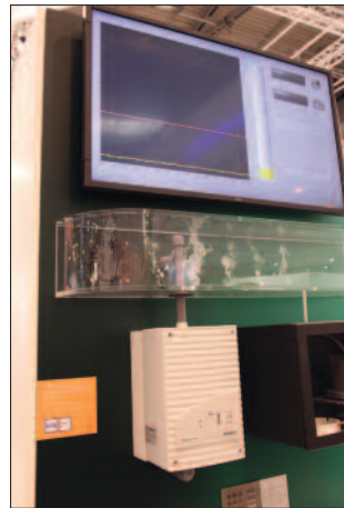
Ansaugrauchmelder: analysiert die angesaugten Gase.

Action Center. Im Freige-lände wurden zweimal täglich von der Firma Haverkamp ( www.haverkamp.de ) Tests an Glasscheiben durchgeführt, die auf der Innenseite mit Folien dieses Unternehmens beschichtet waren. Die Scheiben wurden der Detonation von 40