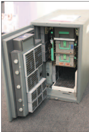
Tresorschutz: schützt vor Sprengung durch Gas.

nen am 29. September 2016 unterzeichneten Kooperationsvertrag zwischen dem BfV und dem ASW Bundesverband Allianz für Sicherheit in der Wirtschaft e.V. (ASW; www.asw-bundesverband.de ) bekräftigt. Vereinbart wurde unter anderem eine Intensivierung der Awareness-Tätigkeiten und eine Einbindung des ASW in das Informationsportal Wirtschaftsschutz ( www.wirtschaftsschutz.info ).