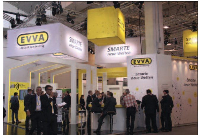
Security Essen: Stand des österreichischen Herstellers von mechanischer und elektronischer Sicherheitstechnik EVVA.

2014 wurden die elektronischen Schließsysteme Xesar und AirKey auf den Markt gebracht. Bei Xesar ist eine Smart Card der Schlüssel zum System von Beschlag, Drücker, Wandle-