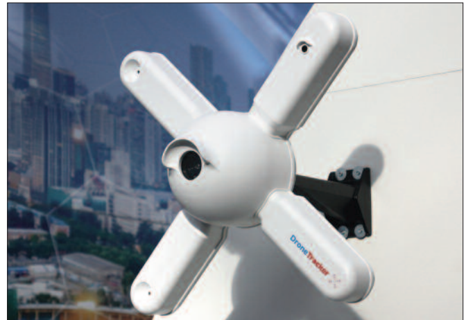
Drone-Tracker: spürt mit vier Sensoren und anhand der von den Drohnen ausgesendeten Signale Drohnen auf.

Kiwi ( www.kiwisecurity.com ) hat ein Verfahren entwickelt, mit dem aus Videos von Überwachungskameras Regen, Schneefall oder Nebel herausgefiltert werden kann, sodass die Bilder ohne diese störenden Einflüsse klarer und aussagekräftiger