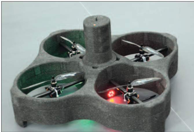
AiR Inspector: Gerät zur Funktionsüberprüfung von automatischen Brandmeldern in hohen (Lager-)Hallen.